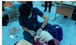
10 JUNI 2023