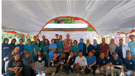
STERIL DINAS RUMAH DINAS CAMAT MAMPANG