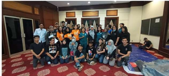
STERIL DINAS GD. NYI AGENG SERANG