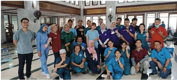
STERIL DINAS WALIKOTA JAKSEL 21 SEPTEMBER 2023