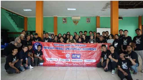
BAKTI SOSIAL STERIL 100 EKOR KUCING