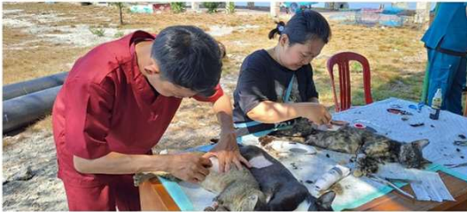
STERIL DINAS PULAU HARAPAN 26 SEPTEMBER 2023