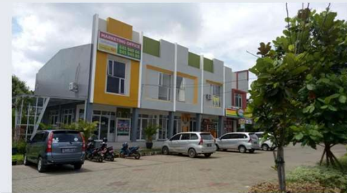
Parkiran dan kompleks

Tentukan sasaran lokasi kegiatan TNR dengan berbagai pertimbangan. Mulai dari tempat rawan kekerasan hewan, tempat pembuangan hewan, maupun aktivitas yang rawan menyebabkan kecelakaan kucing. Pasar, stasiun, tempat parkir, kompleks perumahan yang biasanya menjadi lokasi TNR YPLI