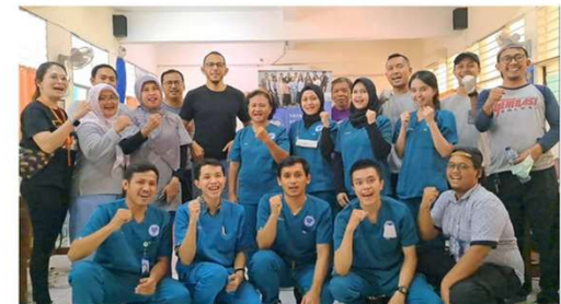
STERIL DINAS SMP 155 JAKSEL