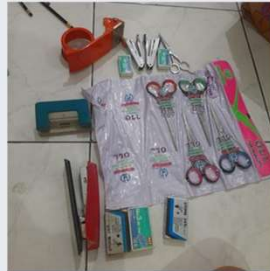
Gunting, lakban, pulpen/spidol